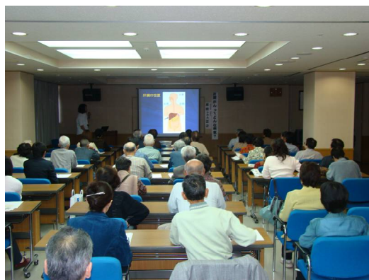
( 第 3 回 : 10 月 )