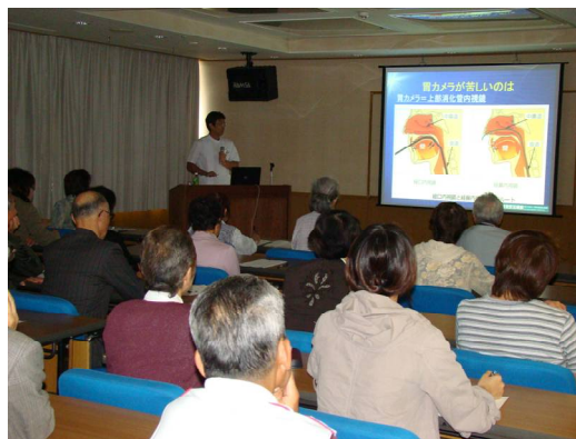
( 第 2 回 : 9 月 )